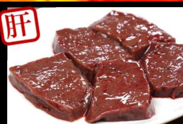
焼レバー650円(税込715円)