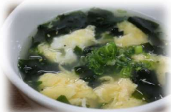
ワカメたまごスープ 430円 (税込473円)