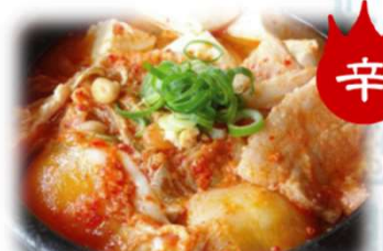
辛 豆腐チゲ 800円 (税込880円)