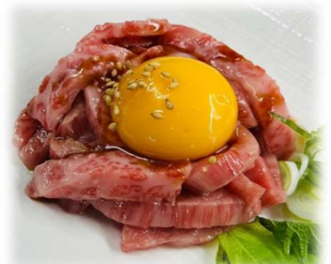
黒毛和牛炙りユッケ 1,360円 (1,496円)