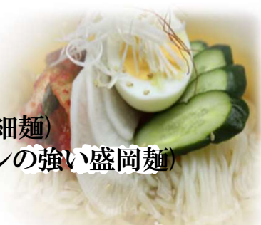
冷麺 (白麺・黒麺) 各880円 (税込968円)