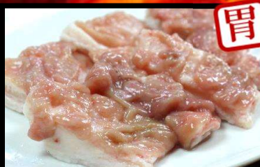
アカセンマイ680円(税込748円)