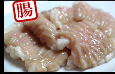
とろテッチャン700円(税込770円)