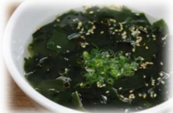
ワカメスープ 350円 (税込385円)