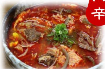
辛 カルビスープ 880円 (税込968円)