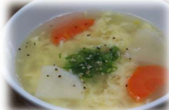
たまごスープ 360円 (税込396円)