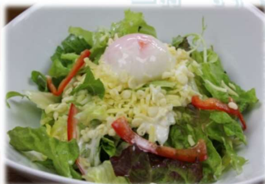
たまチーザーサラダ