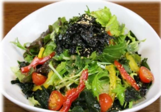
焼肉に合うサラダ