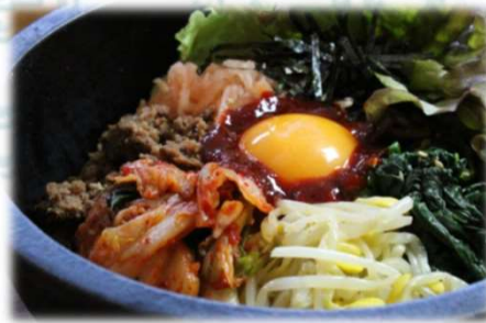
石焼ビビンバ 980円(税込1,078円)