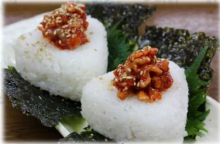
チャンジャおにぎり 550円(税込600円)