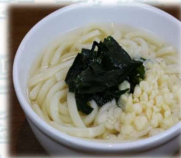
うどん 350円 (税込385円)