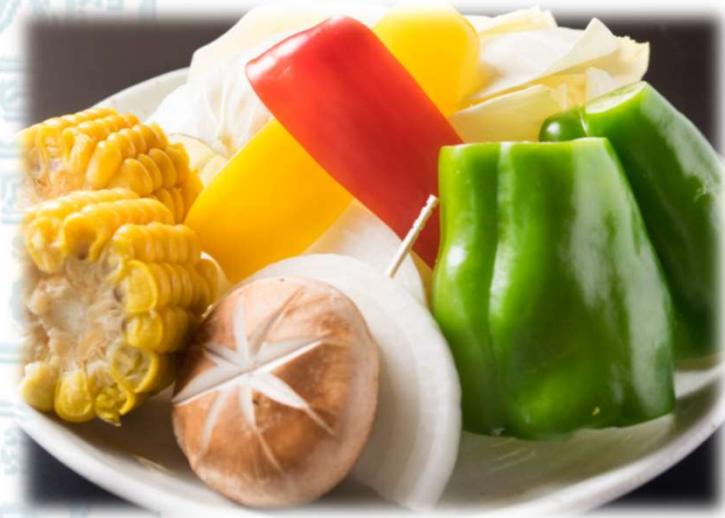
焼野菜盛 (季節により変わることがあります)