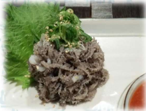
生センマイ 980円 (税込1,078円)