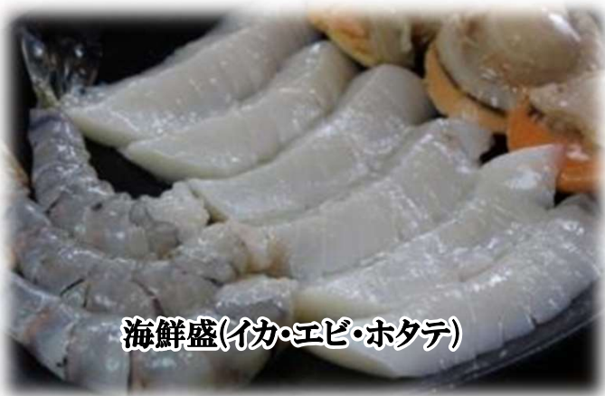
海鮮盛(イカ・エビ・ホタテ)