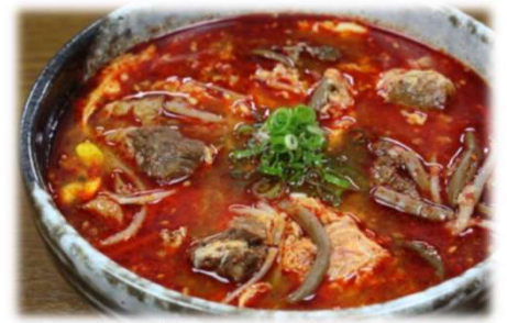
カルビクッパ 980円(税込1,078円)