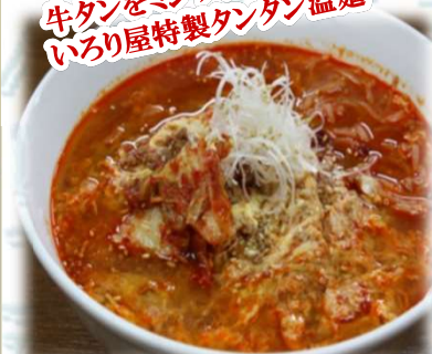
タンタン温麺 880円 (税込968円)