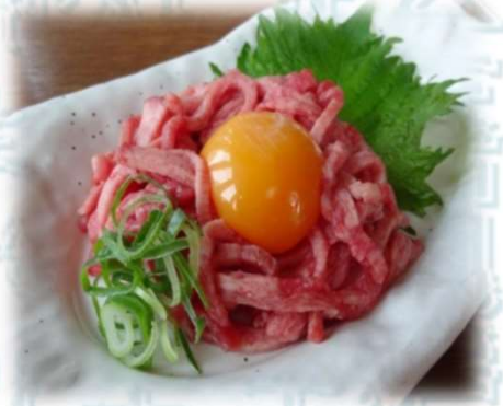
タンユッケ 1050円 (税込1,155円)

生ものご注文のお客様 一般に生ものは食中毒のリスクがあります。 お子様やご高齢の方、抵抗力の弱い病中・病後はお控えください。