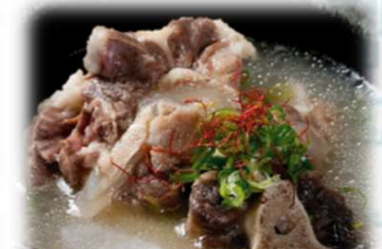
テールスープ 1,000円 (税込1,100円)